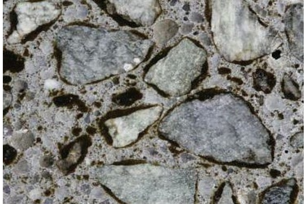
Tyndslip af MC Pot Hole Repair materialet efter hærkning. Den sorte hinde omkring tilslagene er bitumen.

Materialet blandes som en sementmørtel og blir lakt i halvflytende form. Materialet lukkes tett rundt alle hulrom og porer i asfalten og forhindrer dermed vann, salt og frost fra å trenge inn i det reparerte hullet.